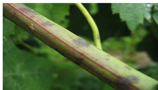
Structures de survie hivernales formées sur le bois