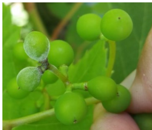
Blanc de la vigne au stade taille de plomb

Il peut engendrer des pertes récoltes importantes tant au niveau de la quantité que de la qualité des baies.