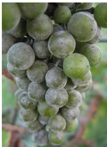
Sporulations de blanc de la vigne sur les grappes et les feuilles